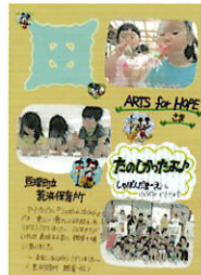
荒浜保育所(宮城県亶理町)