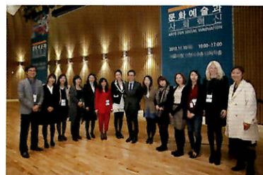
「ARTS for SOCIAL INNOVATION」(韓国/ソウル/2012.11.15) 主催: Soul Foundation for Arts and Culture BRITISH COUNCIL Social Enterprise Network