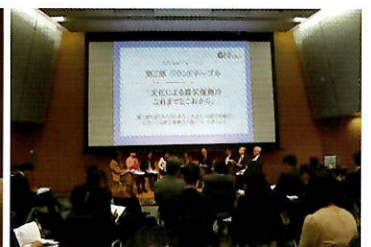
GBFundフォーラム 「文化による震災復興の、これまでとこれから」(東京/2012.12.10) 主催:公益社団法人企業メセナ協議会