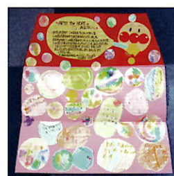
青葉幼稚園(福島県南相馬市)