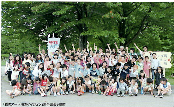
「森のアート 海のゲイジツ」岩手県金ケ崎町

夏休みに、岩手、宮城、静岡で全3回行ったリフレッシュアートキャンプ。気仙沼、石巻、東松島、塩竈、名取、亘理、南相馬、いわきなど、17市町村の子どもたちが参加し、自然体験とアートワークショップを通して地域を越えた交流を育みました。参加アーティストは5組。コスタリカや徳島など、各地で活躍するアーティストやミュージシャンが駆けつけてくれました。