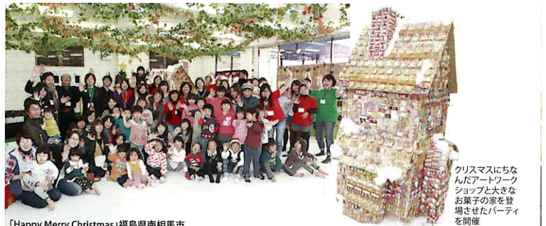
「Happy Merry Christmas」福島県南相馬市

地元NPOや市民団体との協働プログラムを実施しました。地域活性化やまちづくり、子ども支援に取り組む団体とコラボレーションし、住民の皆さんに楽しんでいただくため、さまざまなアートイベントを開催しました。