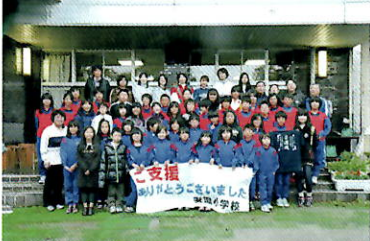
明和保育園(岩手県大船渡市) 安渡小学校(岩手県大槌町)