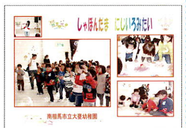
大養幼稚園(福島県南相馬市)