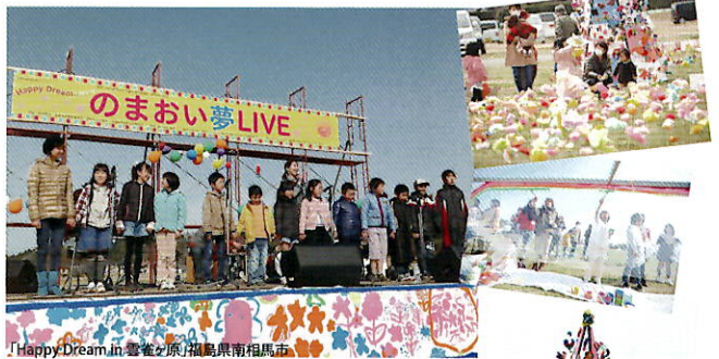
「Happy Dream in 暮春の原」福島県南相馬市

クリスマスにちなんだアートワークショップと大きなお菓子の家を登場させたパーティを開催