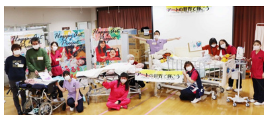
助成: 公益財団法人 テルモ生命科学振興財団