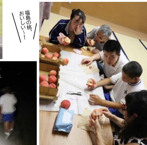
福島の桃、おいしい〜！