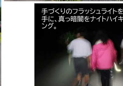
手づくりのフラッシュライトを手に、真っ暗闇をナイトハイキング。