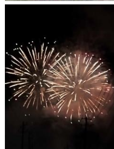
“いなわしろ花火大会”と日程が重なり、思いがけず花火鑑賞もできました！