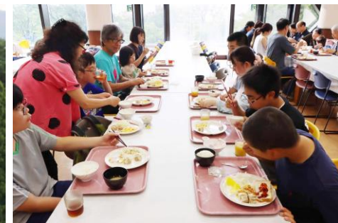
大食堂で食事。3日目にして全員揃った時の感動たるや…！